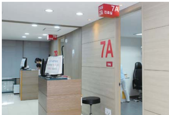
2층 신규 진료실