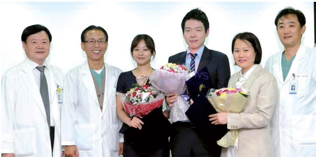
대상, 최우수상, 우수상 수상자들과 함께

이번 콘테스트를 통해 우리 병원은 다시 한번 '고객만족'의 중요성을 깨닫고 고객을 대하는 마음가짐을 새롭게 다졌습니다. 우리 병원은 고객이 만족하는 최상의 의료서비스를 제공할 수 있도록 늘 고민하고 연구할 것이며, 한층 더 높은 차원의 고객감동을 이끌어내기 위해 부단히 노력할 것입니다.