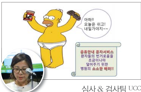
심사 & 검사팀 UCC