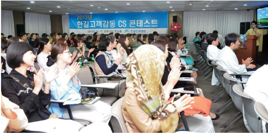
한길고객감동! 2013년 CS 콘테스트

우리 병원은 지난 10월 17일 병원 4층 한길 홀에서 전 임직원이 모인 가운데 '2013년도 한길 CS 콘테스트'를 열었습니다. 이번 행사는 전 직원에게 즐거운 CS 문화를 전파하고 모두가 함께 어울려 좋은 CS 문화를 만들어가고자 마련됐습니다. 이날 콘테스트에는 총 8개팀이 참가해 고객감동을 위한 서비스 정신이 담긴 UCC 영상과 역할극을 보여주었습니다. 실제 서비스 현장의 이야기를 바탕으로 현실감 있고 창의적으로 제작된 작품들은 고객감동을 향한 메시지를 효과적으로 전달, 참석자들의 큰 호응과 공감을 이끌어냈습니다.